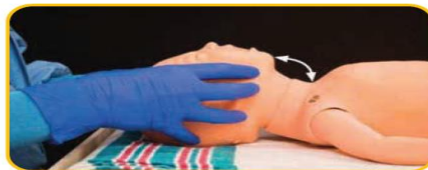
شکل ۷.۳. وضعیت درست بوکشیدن

-استفاده از یک بالش تک مخصوص در صورت اینکه استخوان پس سر نوزاد بزرگ باشد.